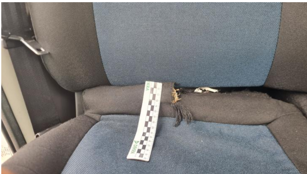
Fot. 55. Fotel PP tekstyl. standard. - pęknięcie 1