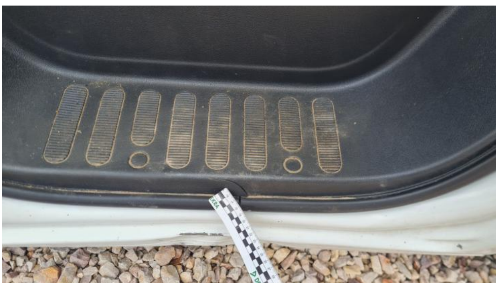
Fot. 28. Zdjęcie do protokołu