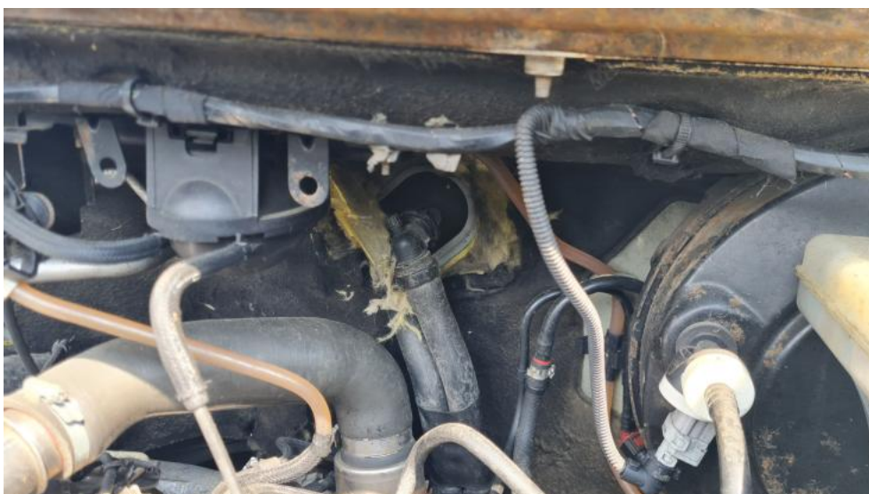
Fot. 24. Zdjęcie do protokołu