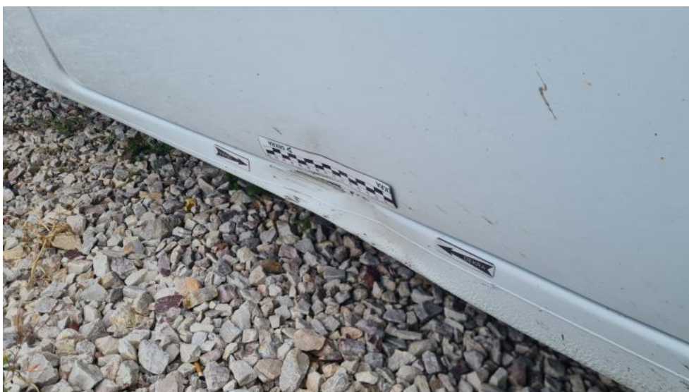
Fot. 46. Próg P - wgniecenie 1