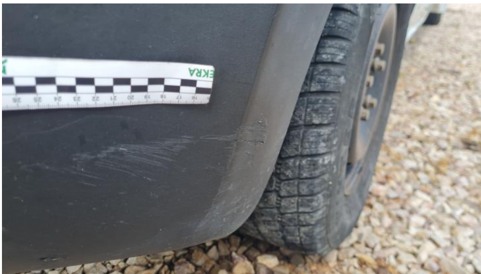
Fot. 43. Zderzak n/lakier. PRZ - zarysowanie 1