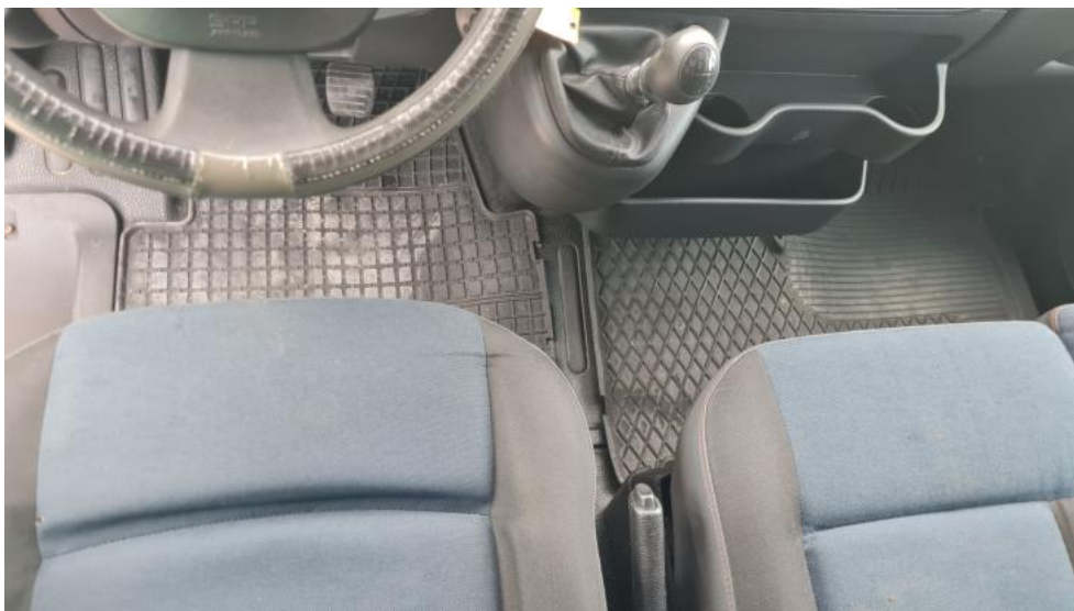
Fot. 19. Tunel środkowy