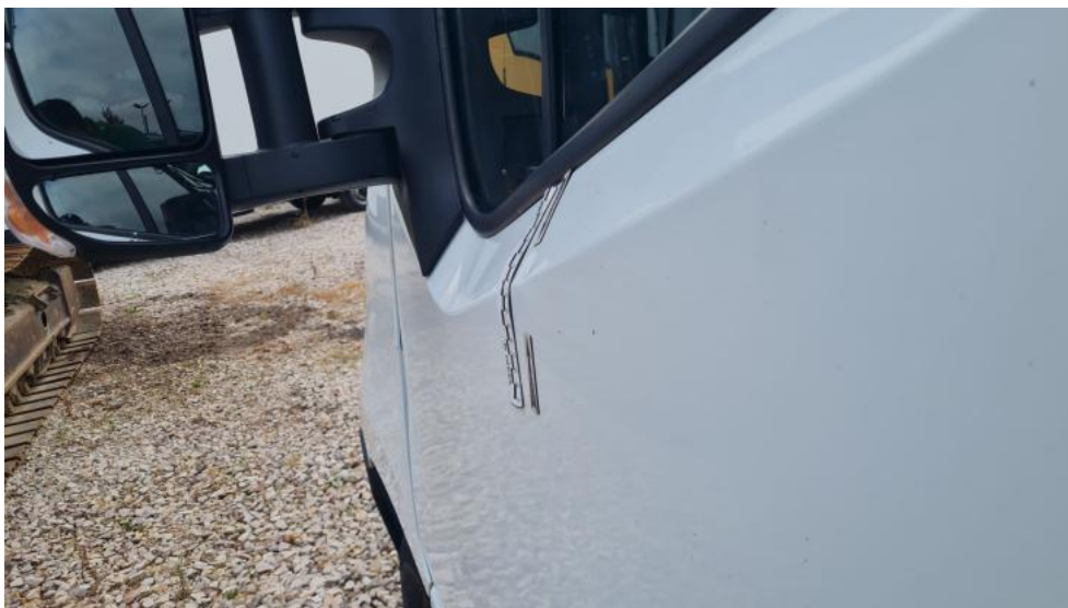
Fot. 49. Drzwi P L - wgniecenie 1