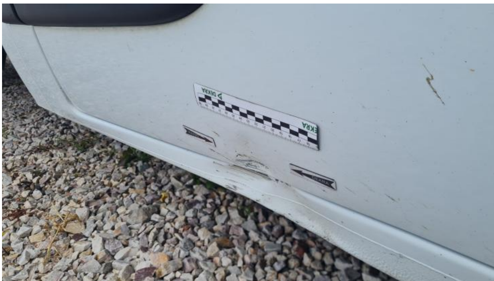
Fot. 45. Drzwi P P - wgniecenie 1