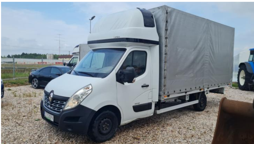
Fot. 1. Przekątna przednia lewa