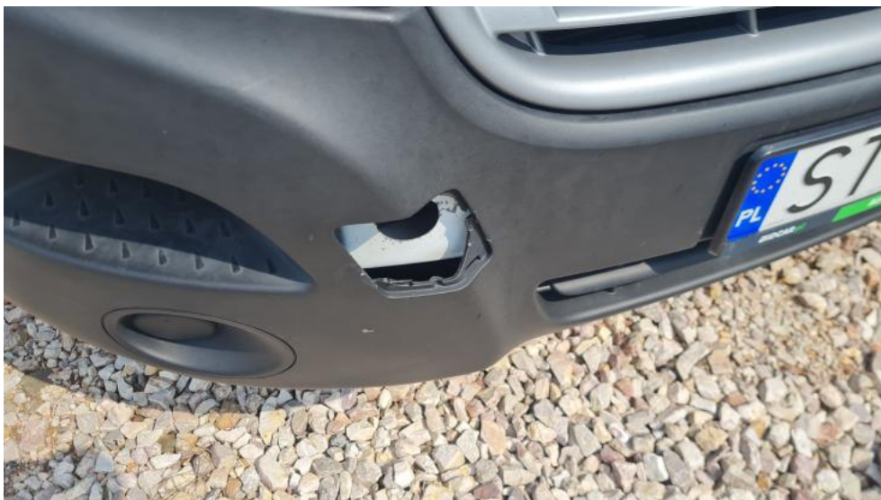
Fot. 25. Zdjęcie do protokołu