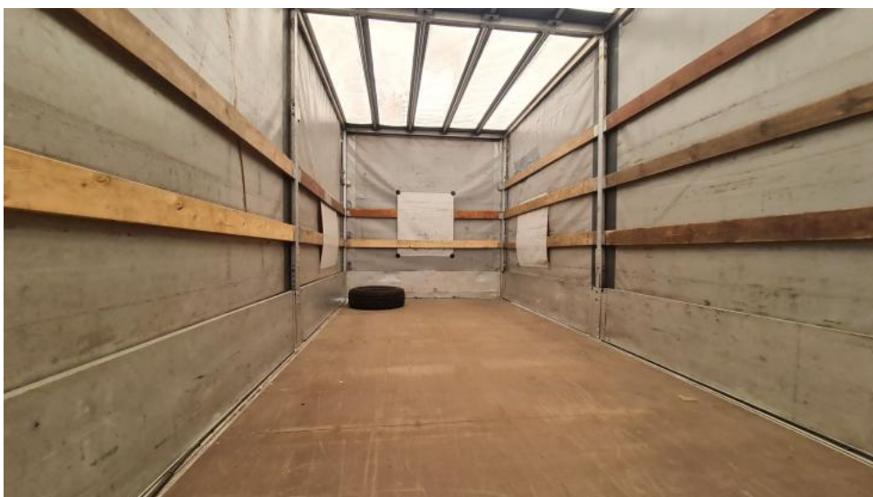
Fot. 22. Zdjęcie do protokołu