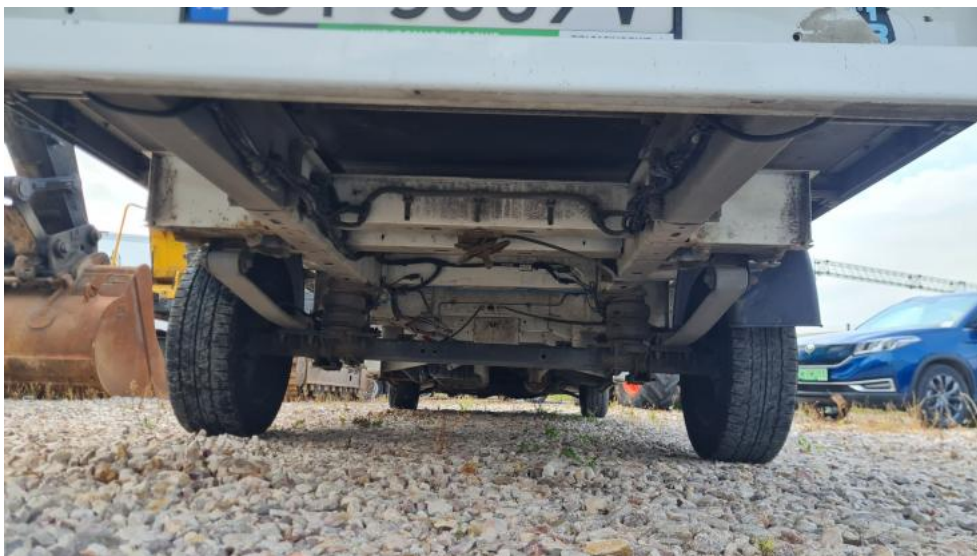
Fot. 11. Spód tył