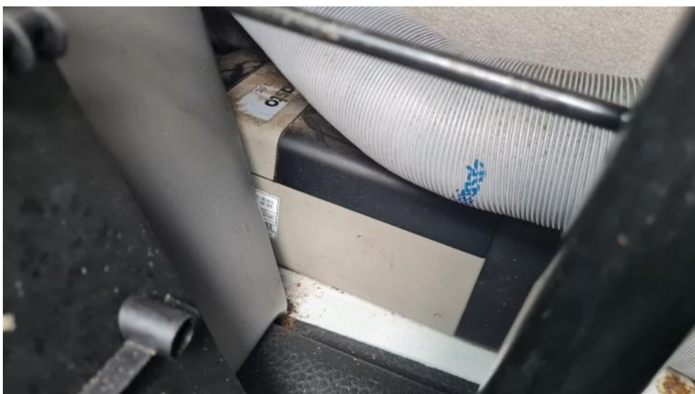
Fot. 26. Zdjęcie do protokołu