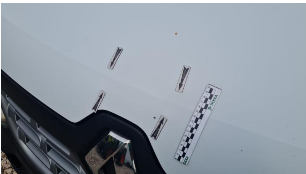
Fot. 40. Pokrywa - zdjęcie poglądowe 1