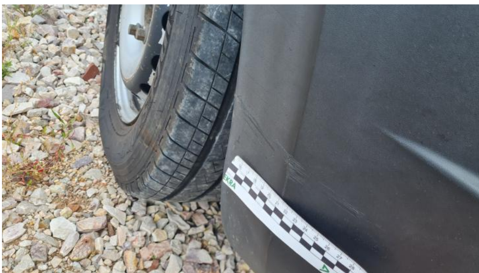
Fot. 44. Zderzak n/lakier. PRZ - zarysowanie 2