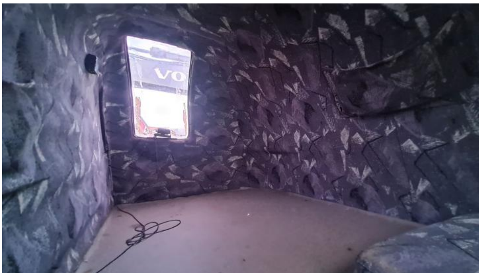
Fot. 37. Zdjęcie do protokołu