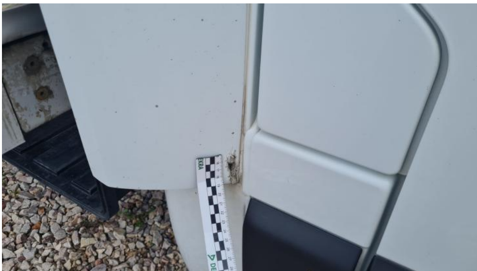
Fot. 27. Zdjęcie do protokołu