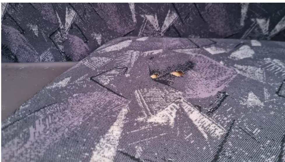
Fot. 38. Zdjęcie do protokołu