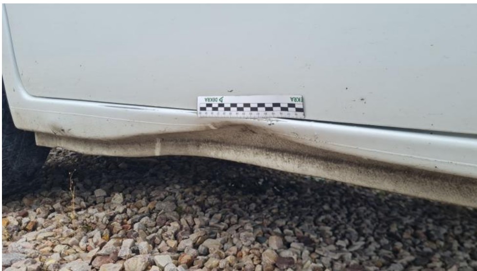
Fot. 51. Próg L - wgniecenie 1