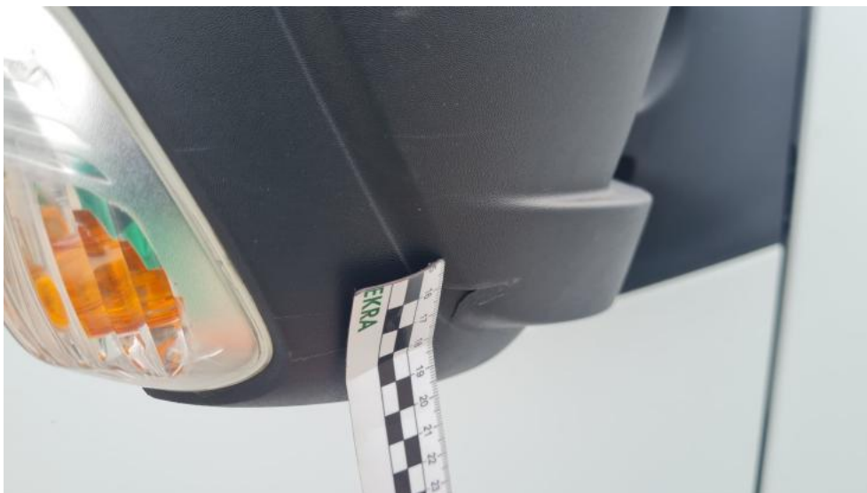
Fot. 47. Lusterko zewnętrzne n/lakier. elektr. P - pęknięcie 1