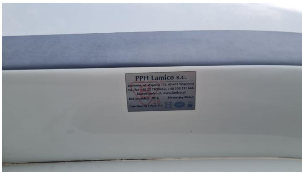
Fot. 29. Zdjęcie do protokołu