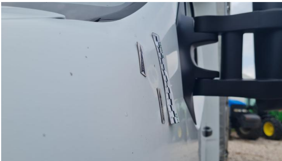
Fot. 39. Błotnik metal PL - wgniecenie 1