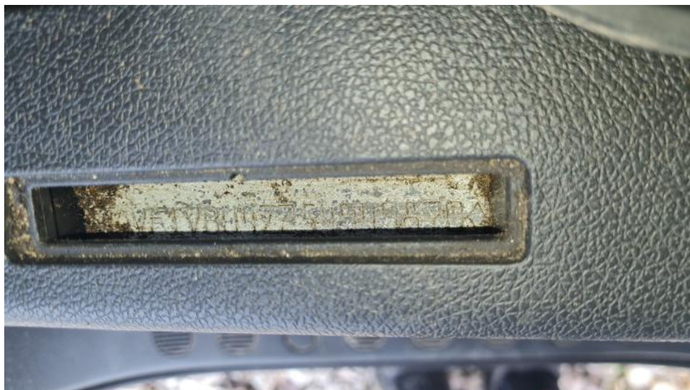
Fot. 7. Numer identyfikacyjny