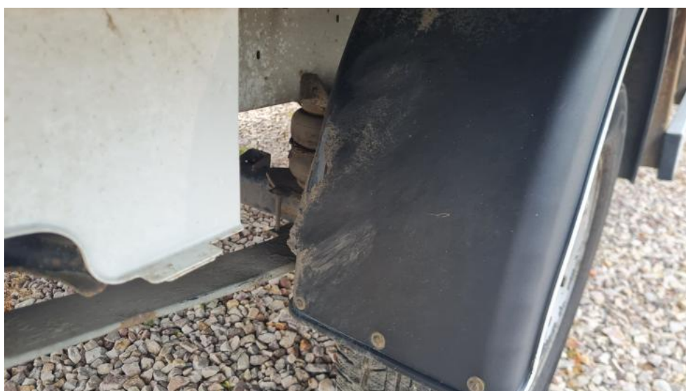
Fot. 30. Zdjęcie do protokołu