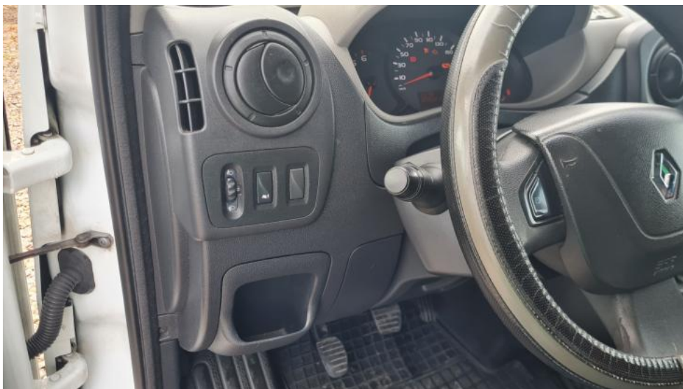
Fot. 21. Kierownica z lewej strony