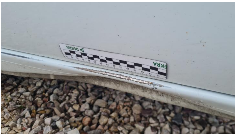
Fot. 52. Próg L - korozja 1