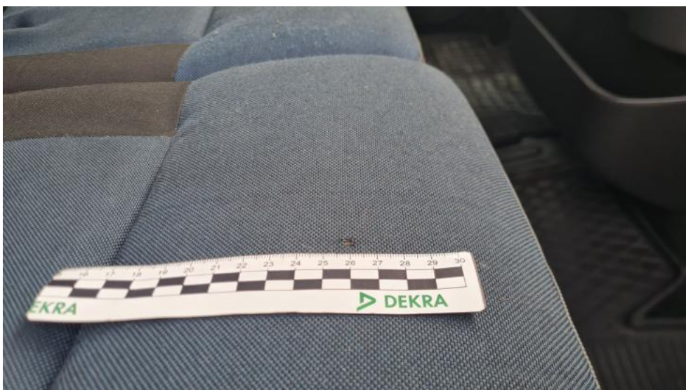
Fot. 56. Fotel PP tekstyl. standard. - przepalenie 1