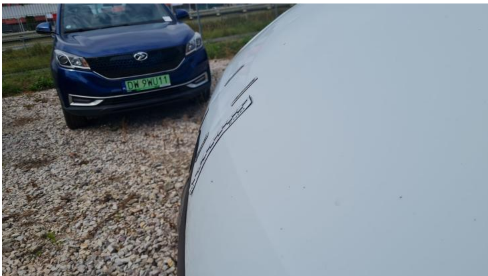
Fot. 41. Pokrywa - wgniecenie 1