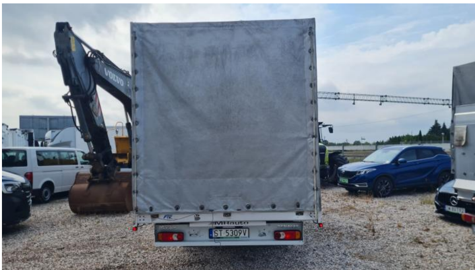
Fot. 5. Tył