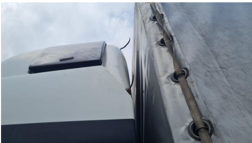
Fot. 36. Zdjęcie do protokołu