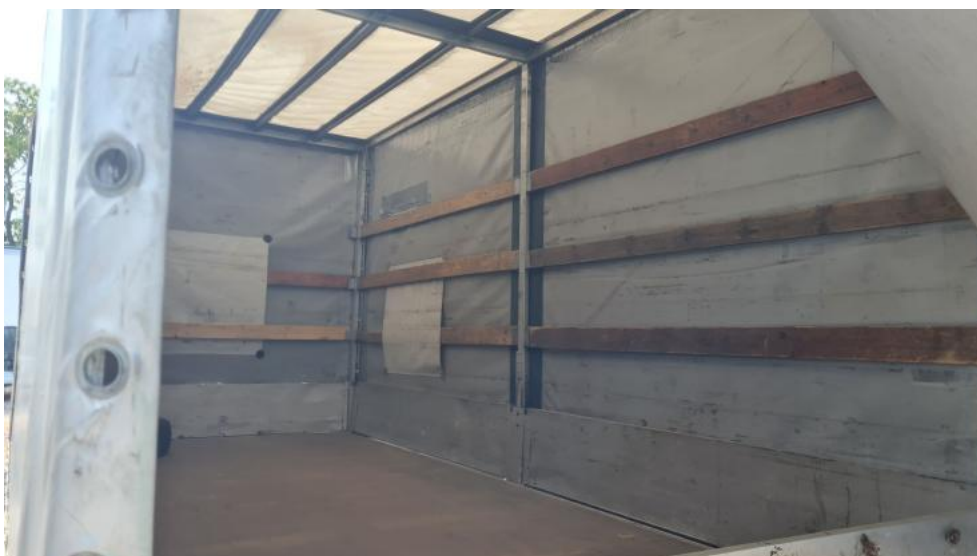
Fot. 12. Bagażnik