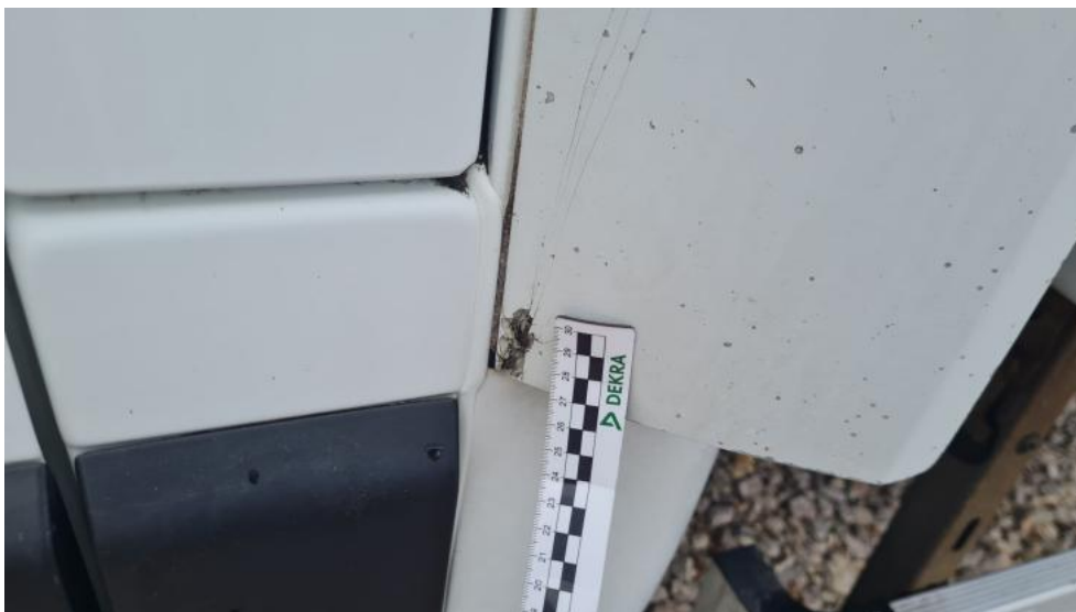
Fot. 35. Zdjęcie do protokołu