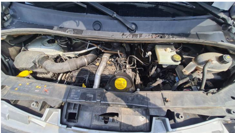
Fot. 9. Komora silnika