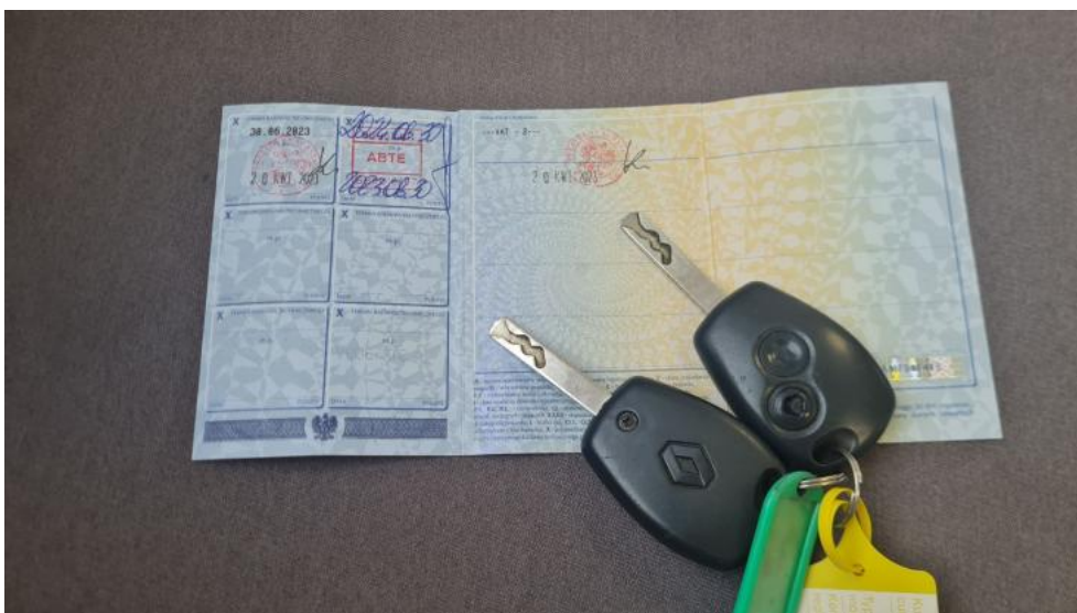
Fot. 14. Dow. Rej. Str.2 i klucze