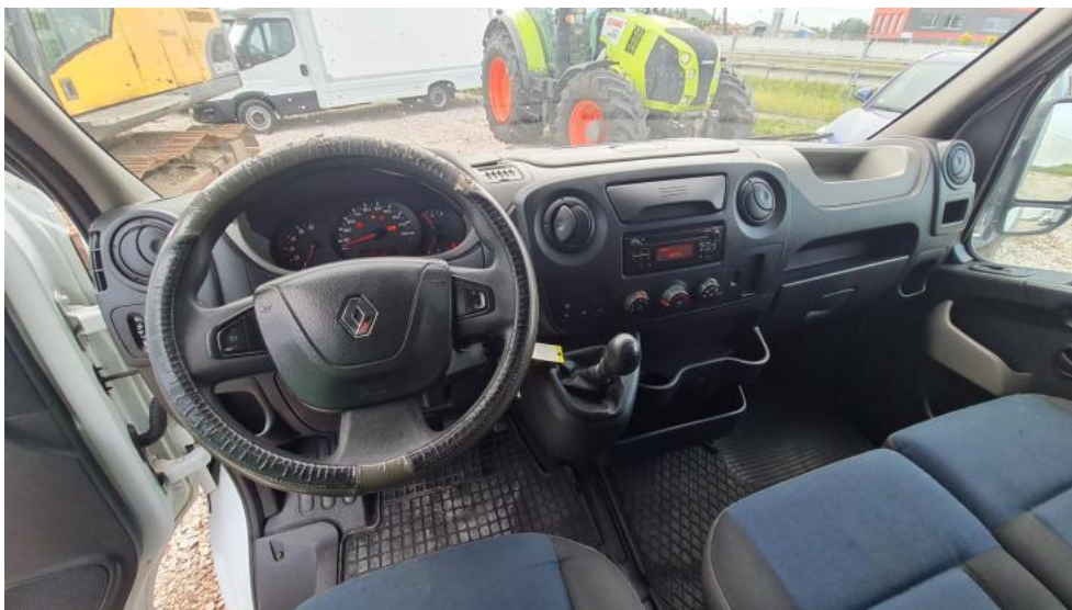
Fot. 17. Widok z tylnej kanapy na deskę rozd.