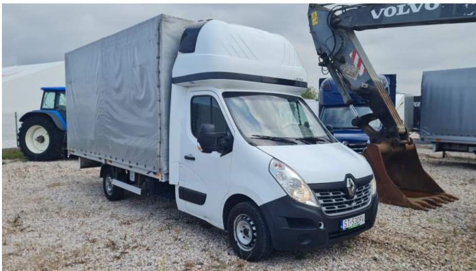
Fot. 3. Przekątna przednia prawa