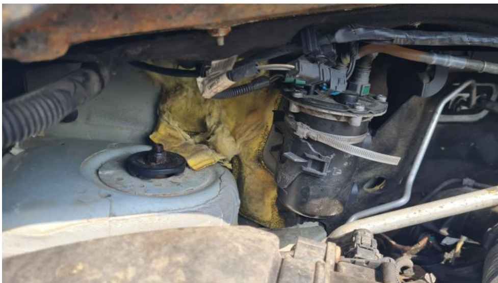
Fot. 23. Zdjęcie do protokołu