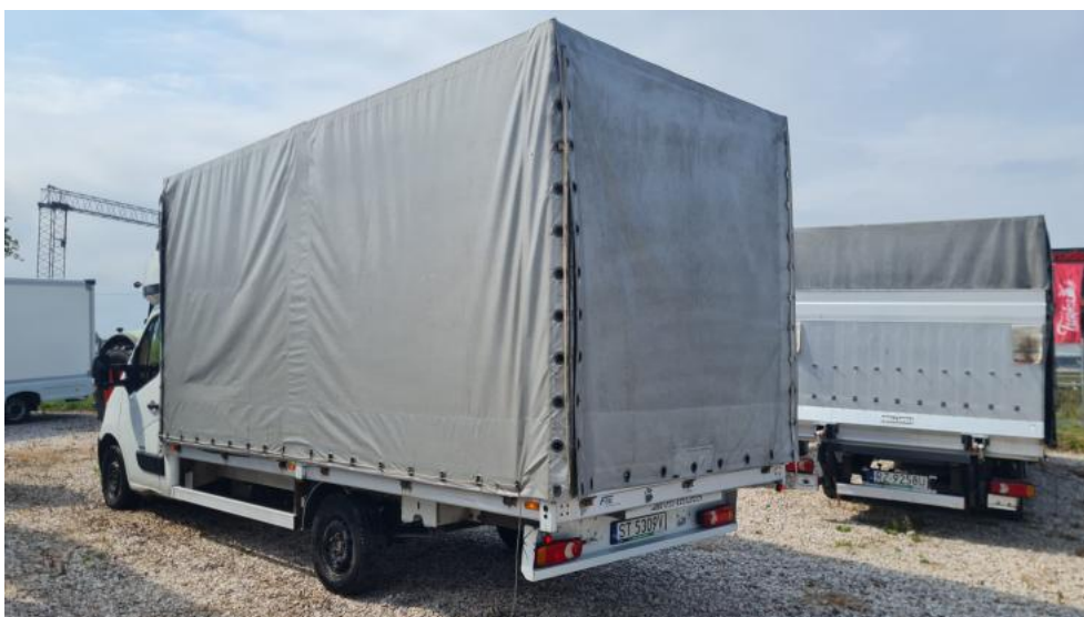
Fot. 6. Przekątna tylna lewa