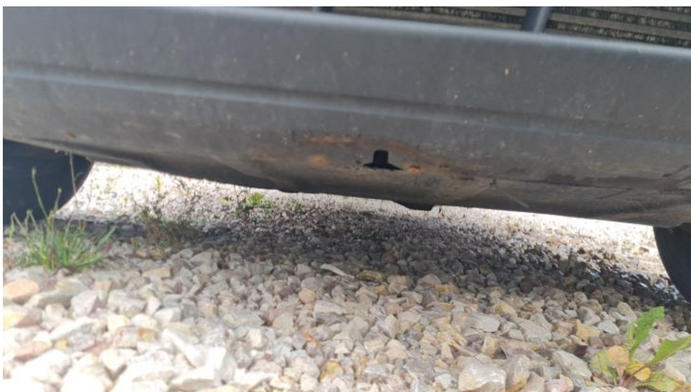
Fot. 10. Spód pojazdu przód