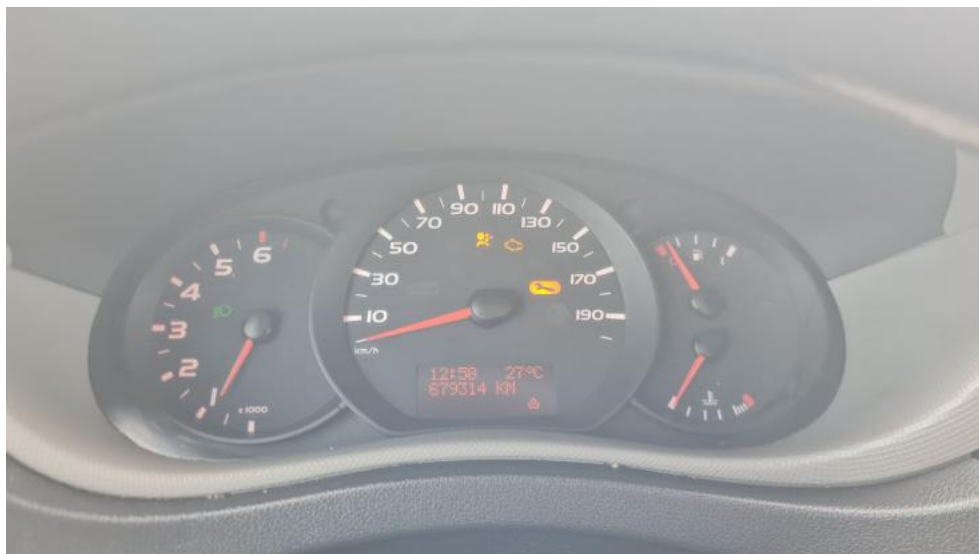
Fot. 15. Zestaw wskaźników