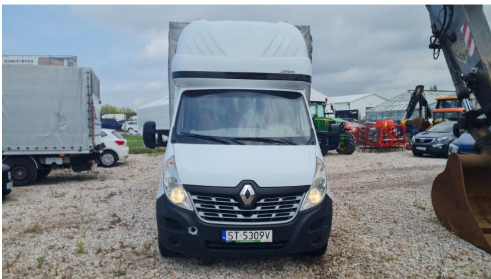
Fot. 2. Przód