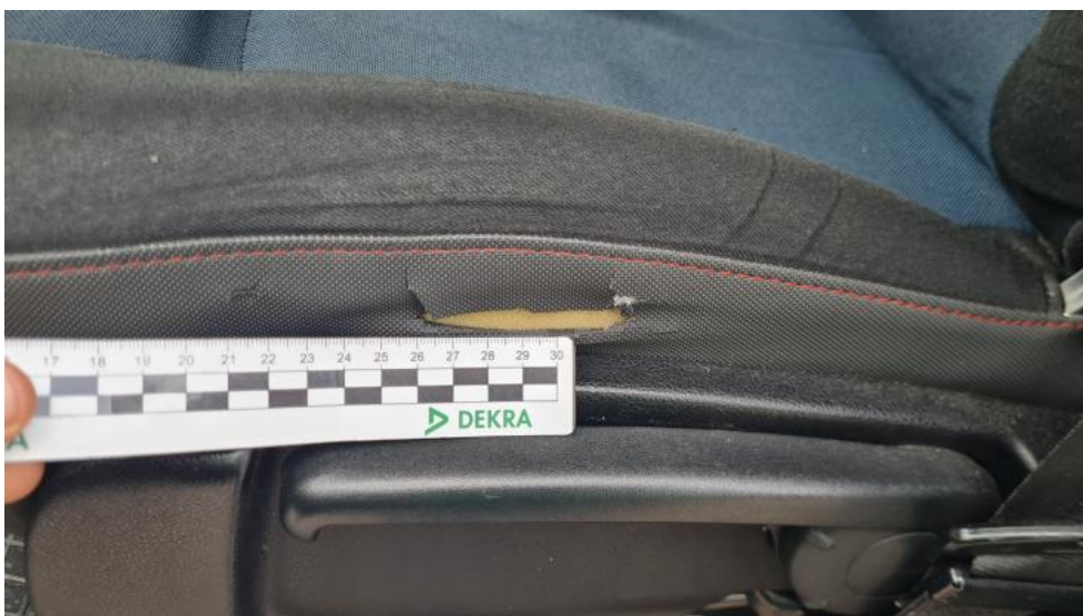
Fot. 54. Fotel PL tekstyl. standard. - pęknięcie 1