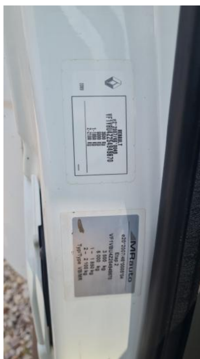
Fot. 8. Tabliczka znamionowa