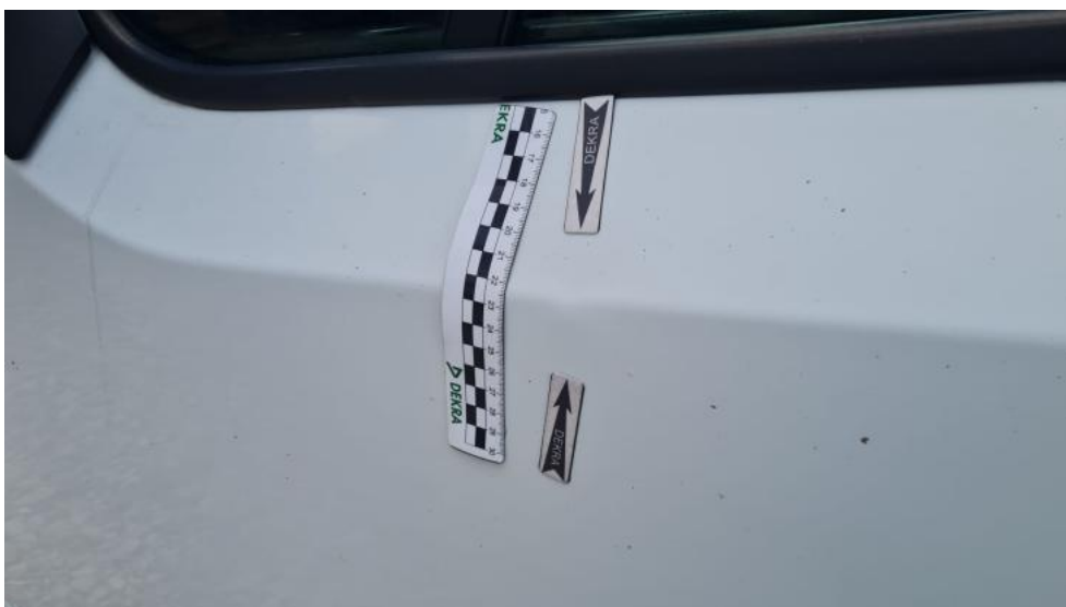
Fot. 48. Drzwi P L - zdjęcie pogładowe 1