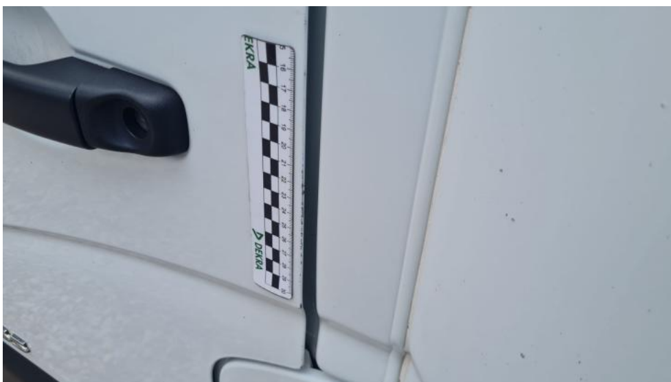
Fot. 50. Drzwi P L - zarysowanie 1