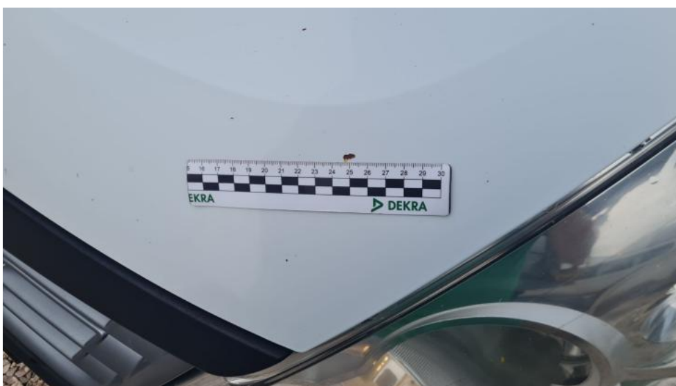
Fot. 42. Pokrywa - korozja 1