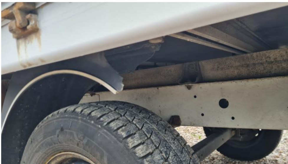
Fot. 33. Zdjęcie do protokołu