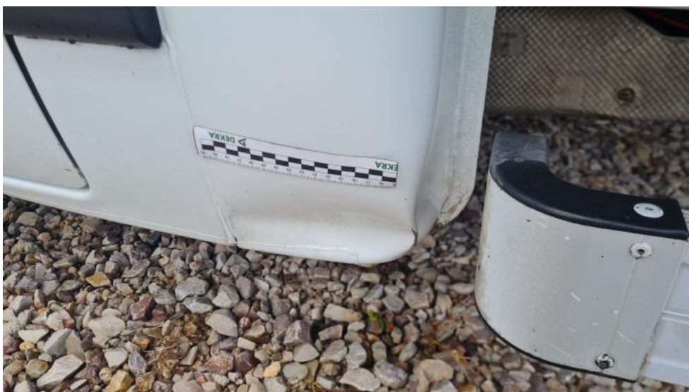
Fot. 34. Zdjęcie do protokołu