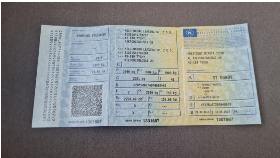
Fot. 13. Dowód rej. Str. 1