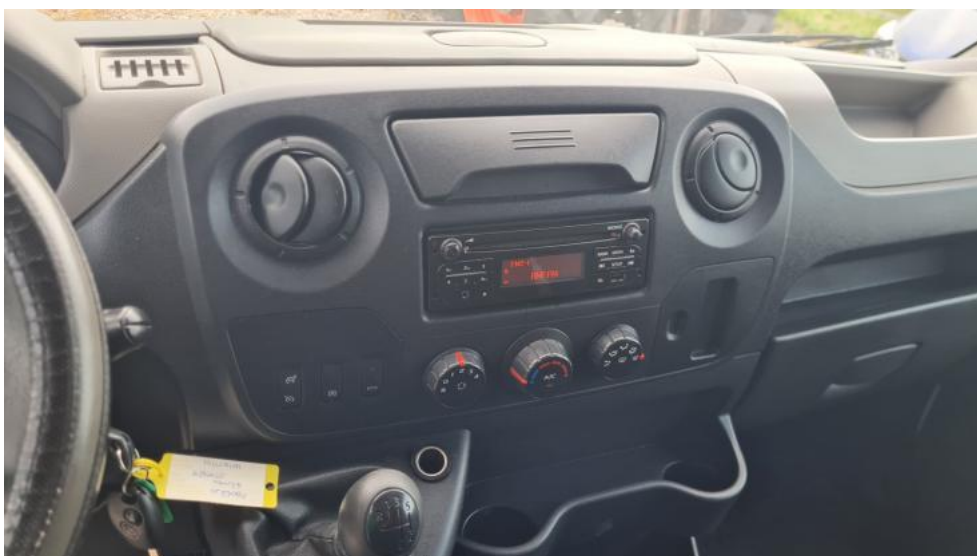
Fot. 18. Konsola środkowa