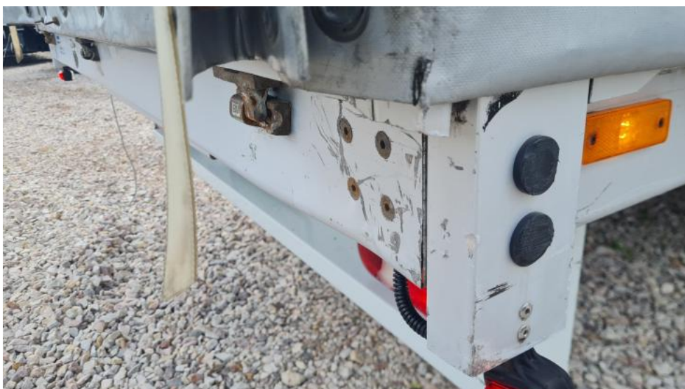
Fot. 32. Zdjęcie do protokołu