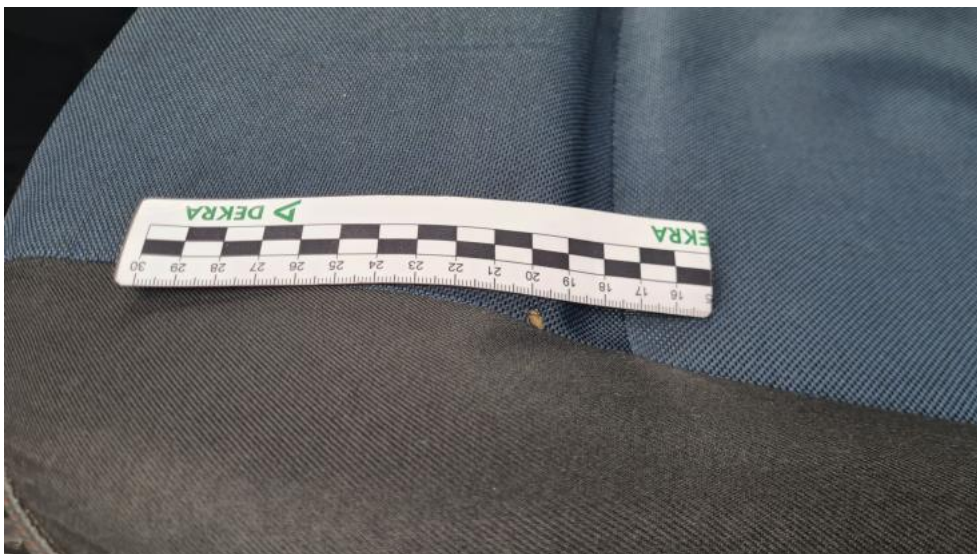
Fot. 53. Fotel PL tekstyl. standard. - przepalenie 1