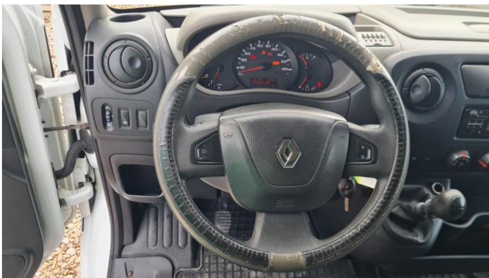
Fot. 20. Kierownica (na wprost)