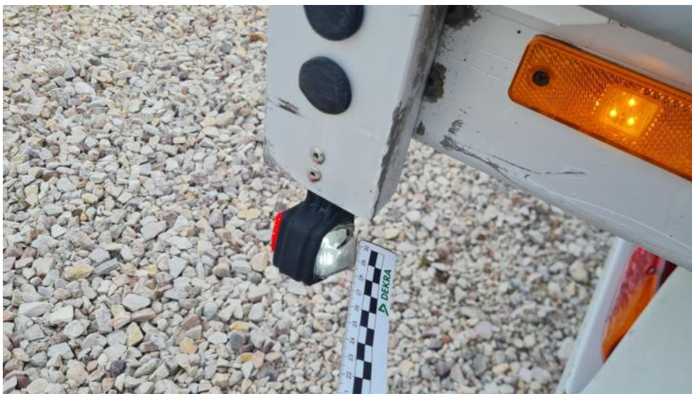
Fot. 31. Zdjęcie do protokołu