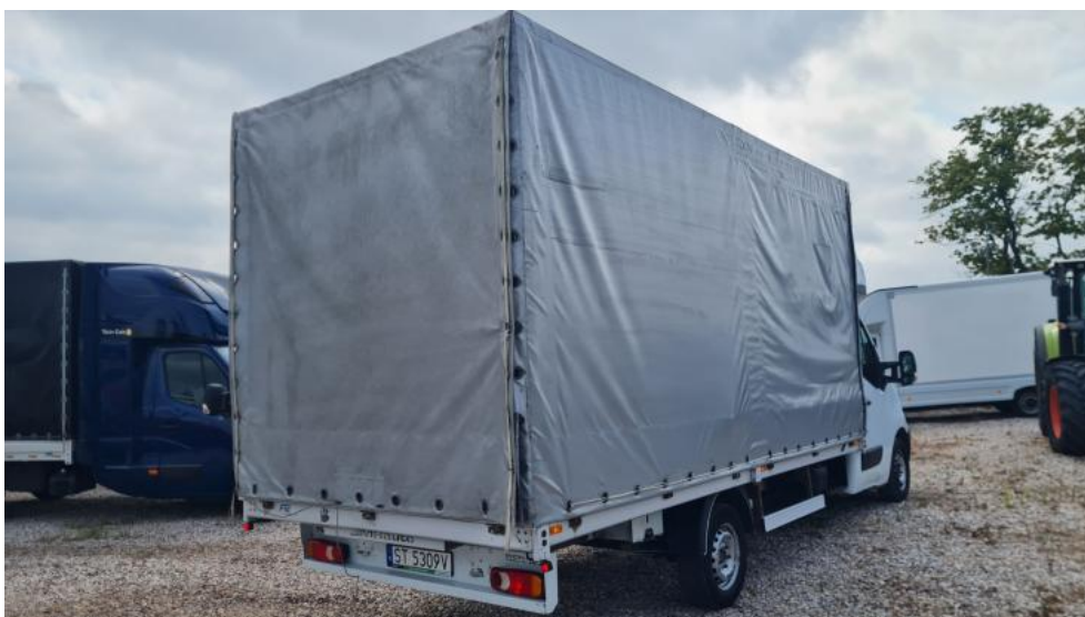
Fot. 4. Przekątna tylna prawa